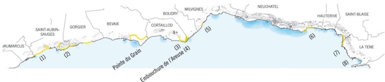
Fig. 1 : Contexte et secteur d'intervention (Extrait du Plan directeur des rives du lac - 2017) 2

L'objectif est de rapprocher ce sentier autant que possible du bord de la rive - en se basant sur le droit de passage inscrit dans la loi - tout en tenant compte des différentes contraintes locales (topographie, milieux naturels, intérêts privés). Dans sa configuration actuelle (2020), le « Sentier du Lac » est localisé proche des rives dans sa plus grande majorité. Cependant, par endroits, il s'éloigne fortement des rives ou ne présente pas une qualité optimale de parcours (longue une route, à l'arrière de maisons,...).