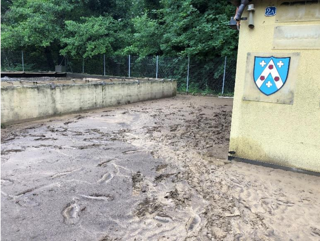
Limons à évacuer (STEP Vaumarcus)