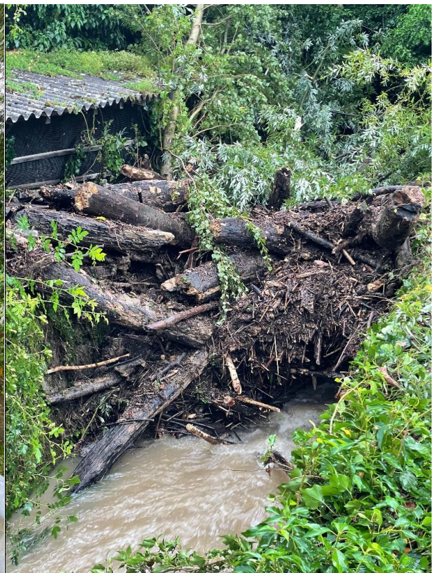
Evacuation des embâcles de bois (pont CFF, Vaumarcus)