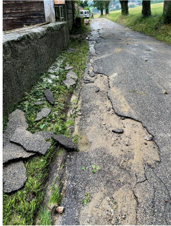
Sécurisation bords de chaussées (route Prés Juniers – Prise Robert, Montalchez)