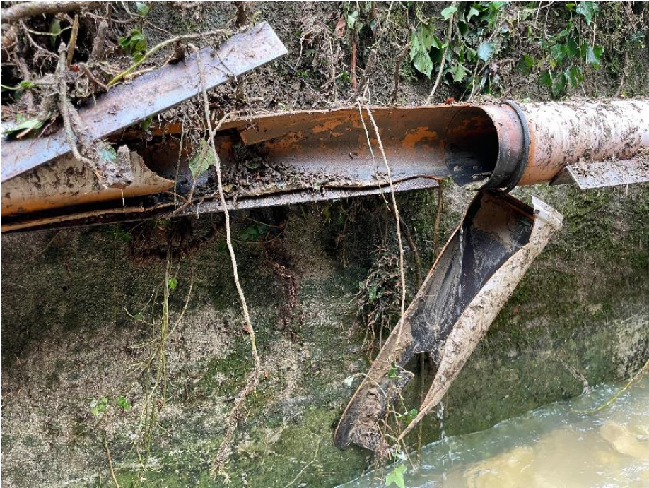
Conduite eaux usées à réparer (La Vaux, Vaumarcus)