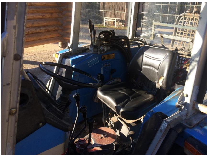
Intérieur de la cabine