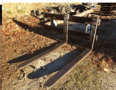
Fourche à palette