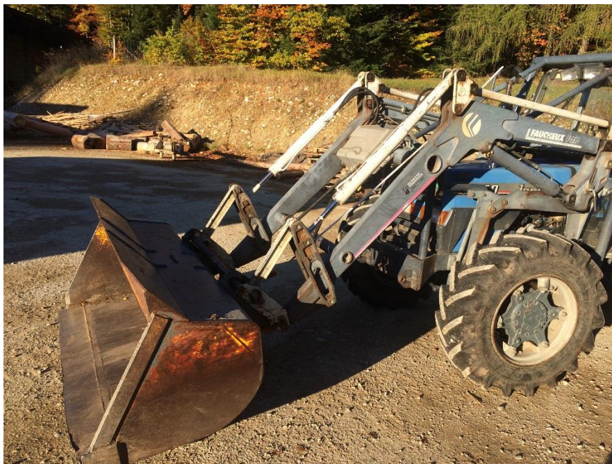
Frontal Fauchaux F2P