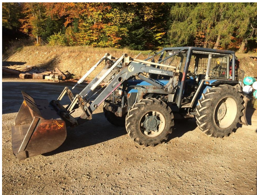
Landini DT 8860