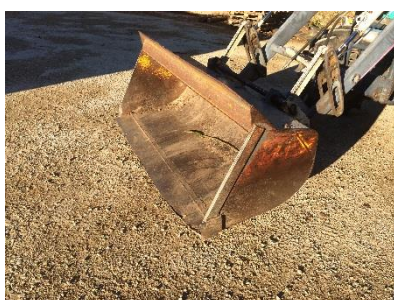
Godet à terre