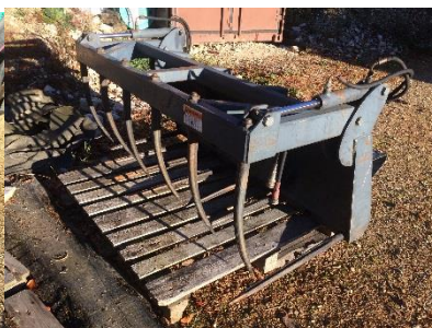
Fourche crocodile à fumier