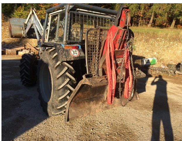
Treuil Igland 9001 Grosso 8t