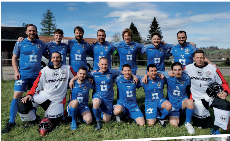
La seule équipe du club évolue en 3 e ligue et est présente avec un stand à la Miaou.