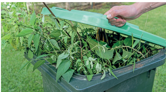
Des déchets verts bien triés donnent du biogaz de meilleure qualité.

Une meilleure qualité des biodéchets permettrait d'optimiser leur transformation en compost ou en biogaz, tout en réduisant les coûts liés à l'élimination des déchets indésirables.