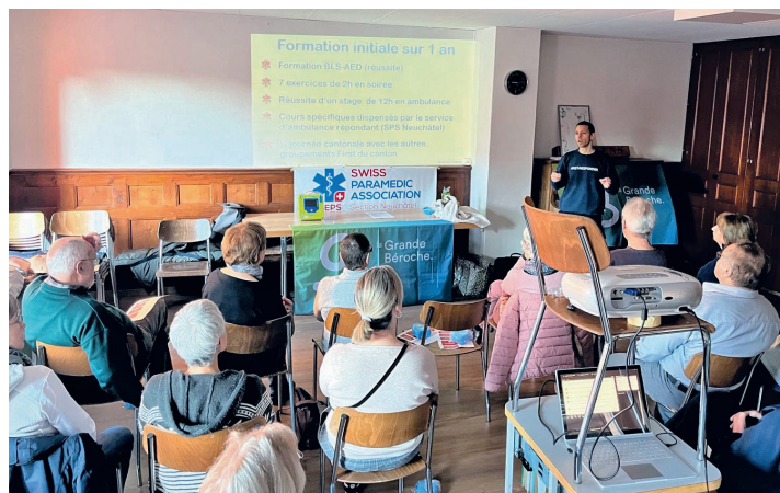
L'assemblée était attentive lors des cours proposés la Salle de spectacles de Saint-Aubin-Sauges... tout comme à Fresens.