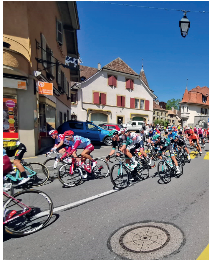
Le Tour de Romandie sera de retour dans la commune, en 2024, pour une étape féminine et en 2025 pour les hommes.