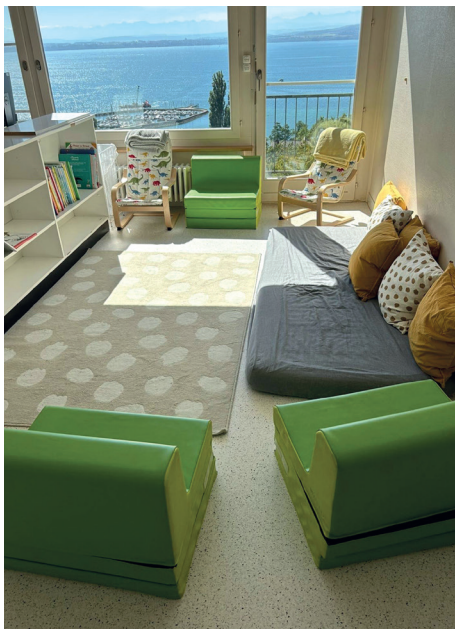
De belles ouvertures sur le lac et des pièces baignées de lumière sont de nouveaux atouts pour La Parenthèse.

Poursuivant l'harmonisation des horaires d'ouverture, douze places ont été ouvertes à Gorgier pour le vendredi matin en continu destinées aux 1 res années. Ceci a permis de libérer des places dans la structure de