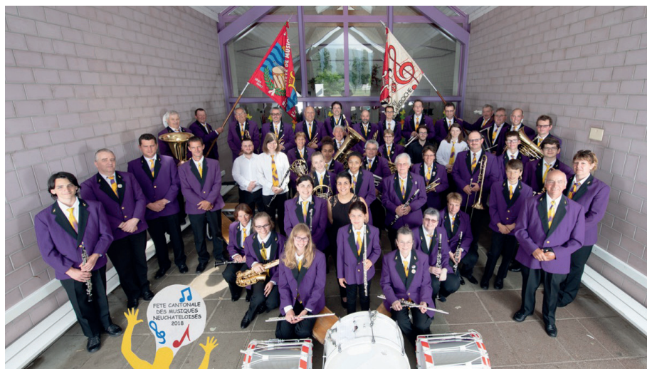
La Fanfare Béroche-Bevaix dans leur uniforme... violet, bien sûr!

Le comité de rédaction a décidé de présenter les sociétés locales de la commune. Pour cette édition, c'est au tour de la Fanfare Béroche-Bevaix de se présenter.