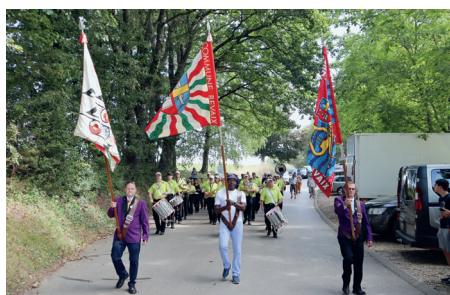
La Fanfare Béroche-Bevaix a animé le parcours.

Nous remercions les membres des commissions des relations publiques et sports-loisirs-culture, ainsi que le personnel communal, qui ont œuvré à la réussite de cette belle journée. Nous adressons nos sincères remerciements à la population pour avoir répondu à notre invitation en si grand nombre!