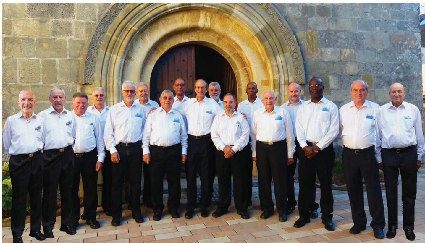
Les membres du chœur se réunissent une fois par semaine pour répéter.

Pour tous renseignements, contactez René Schleppe, président, au 032 846 16 15 ou 079 374 14 27, courriel: schleppir@net2000.ch